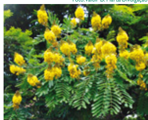
A Sibipiruna colore o chão de amarelo

Em toda a Região Sudeste é comum ocorrerem chuvas mais intensas e frequentes, marcando o período de transição entre a estação seca e a estação chuvosa. É durante a primavera que iniciam-se as pancadas de chuva no final